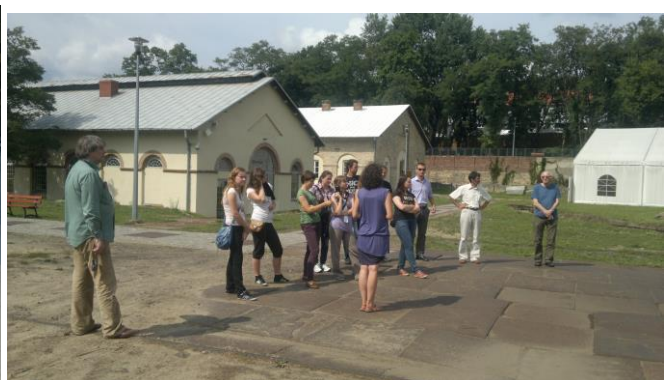
Warsztaty wąchock 2012- w Muzeum w Starachowicach