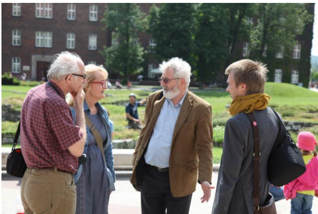
Warsztaty Wąchock 2013-obrady seminarium i wizyta na Wawelu