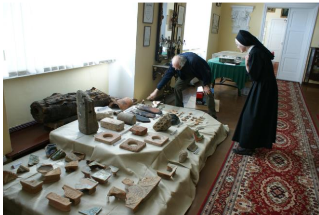
Warsztaty Trzebnica 2012- w czasie prac