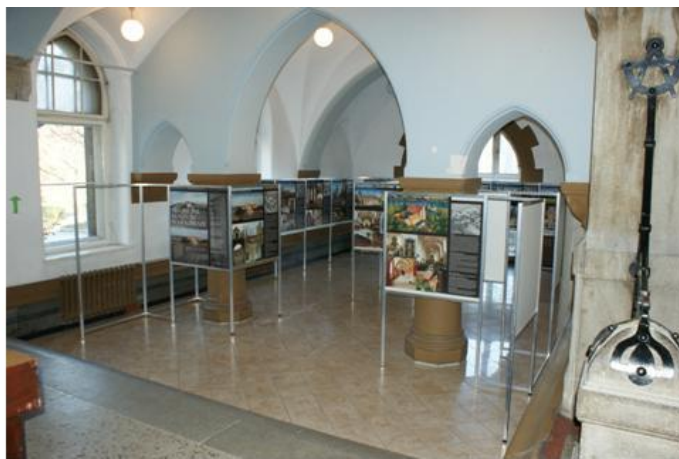
Obrady 14 listopada 2009 komisji i wystawa w salach Wydziału Architektury Politechniki Wrocławskiej