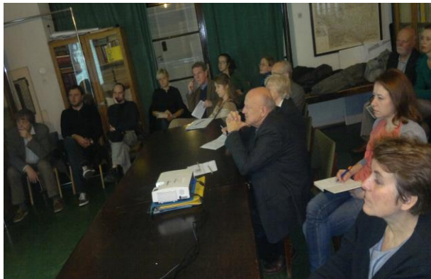
Seminarium z cyklu Autentyzm, 2012