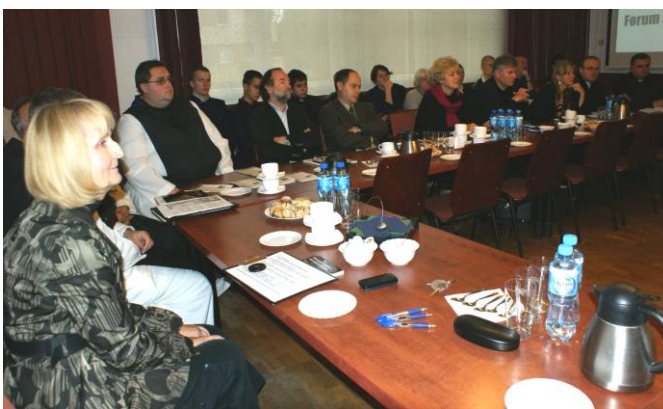
Forum scientiae cisterciense w dniu 30 września 2010 roku