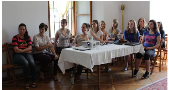
Warsztaty Wąchock 2012- seminarium