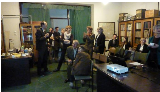
Seminarium z cyklu Autentyzm, 2013