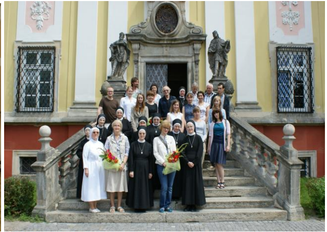
Warsztaty Trzebnica 2012- seminarium