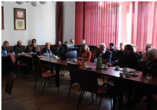
Rozmowy o architekturze sakralnej- spotkanie 17 lutego 2007 roku