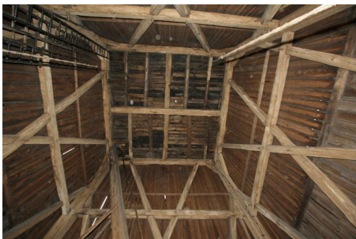
fot.8 Szkieletowa konstrukcja dzwonnicy w Poniszowicach