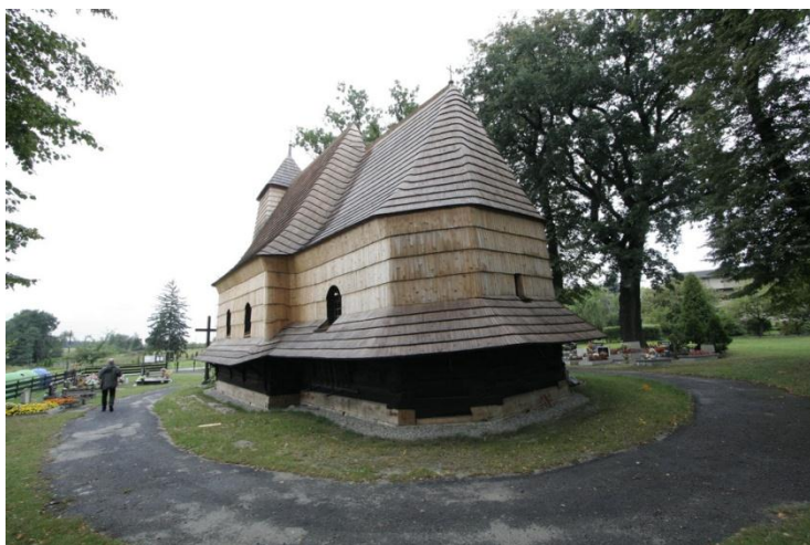
fot.10 Kościół w Zacharzowicach po pracach konserwatorskich.