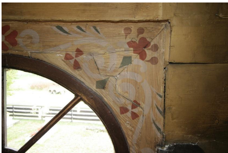
fot.14. Fragment dekoracji otworu okiennego - Zacharzowice