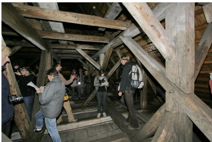
fot.4. Uczestnicy warsztatów na poddaszu kościoła wernicy