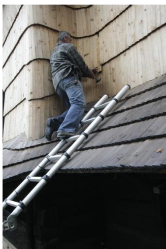
fot.12. Wstawianie gontu, znalezione przy kościele, a który wypadł z poszycia ciany ó Zacharzowice