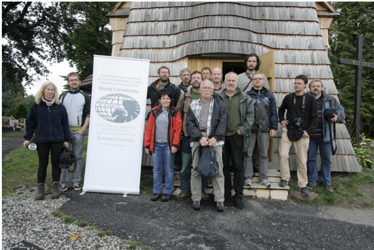
fot.16. Uczestnicy warsztatów przed kościołem w Zacharzowicach.

Dodatkowe informacje o Letniej Szkole Sutkowy Dul mo na uzyska kontaktuj c si na adres organizatorów w Czechach: roofs@roofs.cz Informacje na temat udost pnionych do ogl dzin obiektów w Polsce mo na otrzyma w Komisji Drewna PKN ICOMOS wood.icomos.pl@gmail.com