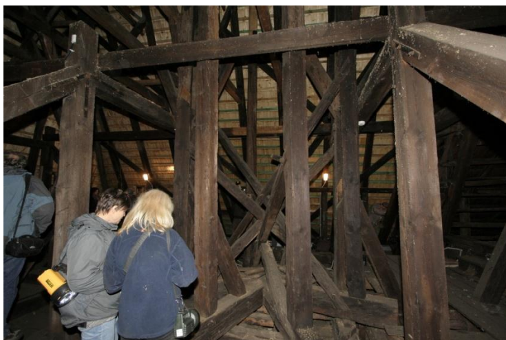
fot.7. Ogólny widok konstrukcji szkieletu w kościele w Poniszowicach