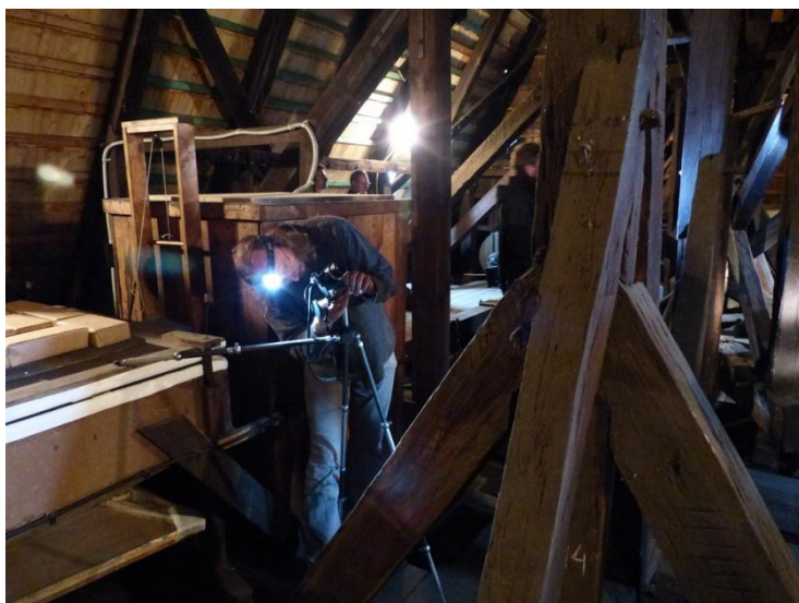
fot.9. Dokumentowanie konstrukcji wióby w kościele w Poniszowicach