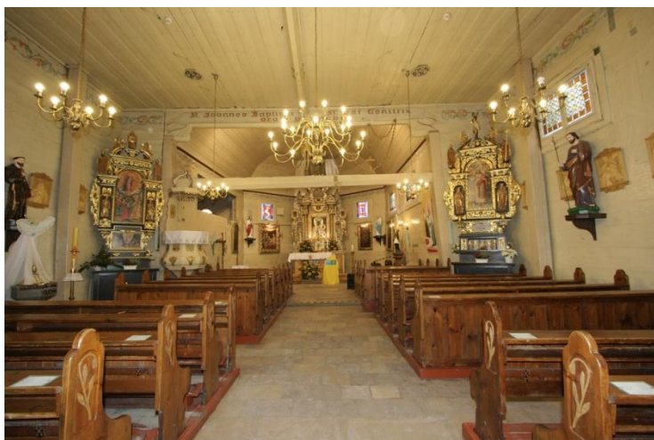
fot.6 Wnętrze kościoła w Poniszowicach ówczesny stan obecny