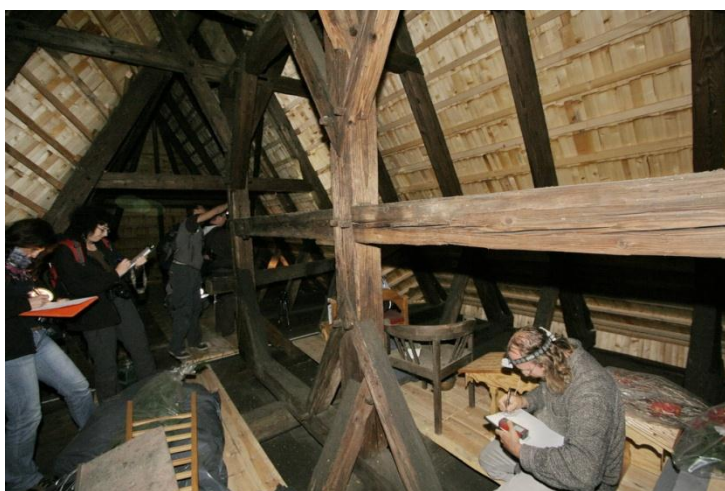
fot.15. Dokumentowanie konstrukcji dachowej w Zacharzowicach