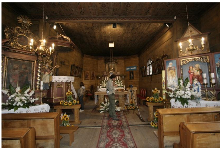
fot.13. Wnętrze kościoła w Zacharzowicach