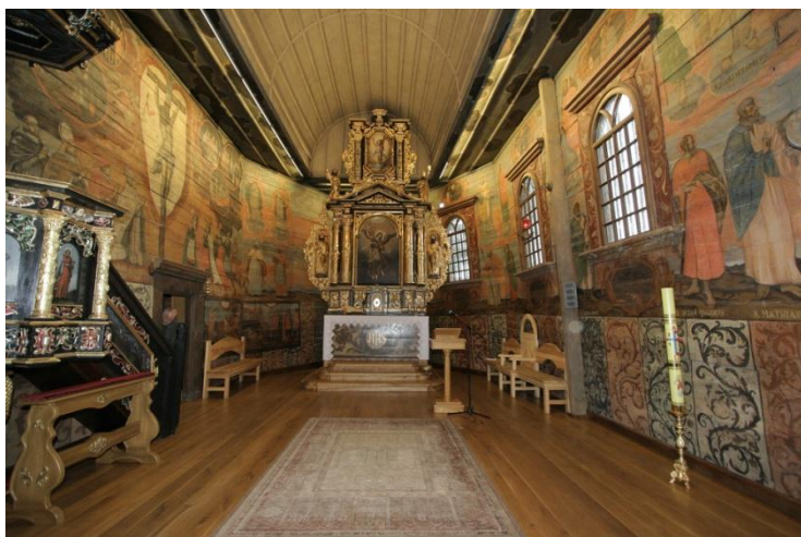
fot.2. Wnętrze kościoła wernicy po pracach konserwatorskich.